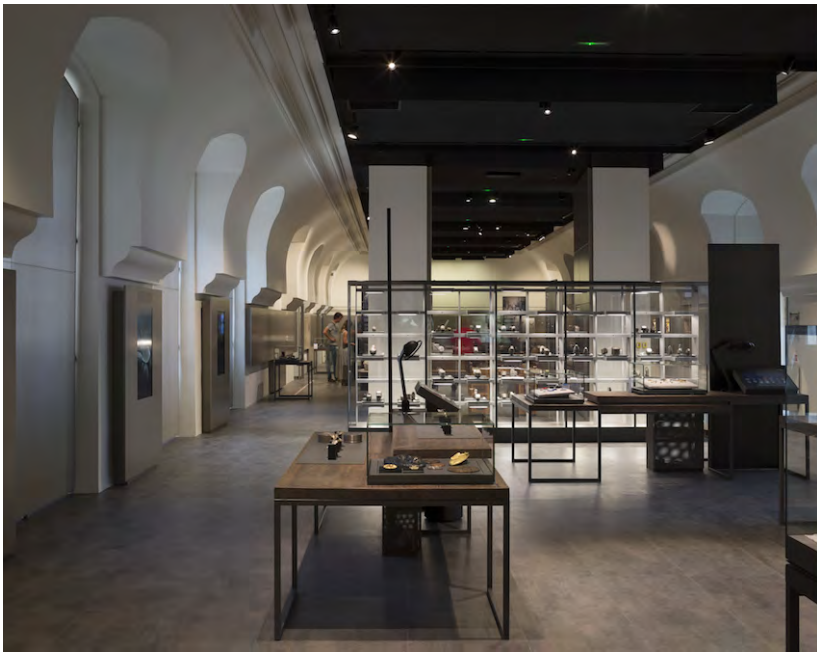
Fig. 5. La salle de la manufacture © Agence Philippe Prost.

par la maîtrise d'ouvrage, les deux premières phases de travaux redonnent à la Monnaie le faste qu'elle avait en partie perdu. Il y aurait beaucoup à dire sur les raffinements de l'architecture de Philippe Prost, à mi-chemin entre le savoir faire issus de la tradition italienne de l'intervention sur l'existant et la croyance en un modernisme tempéré à la française. Le nom du projet Métalmorphose porté par Christophe Beaux était un nom de guerre ; il a changé depuis pour le « 11 Conti », et évoluera sans doute encore. Entre temps, la métaphore métallique aura peut-être servi à convaincre de sa pertinence ceux des partenaires qu'effrayait un type de matériau et d'écriture – la tôle perforée – marqué au coin de l'utilisation aujourd'hui très consensuelle et par ailleurs très bien venue dans l'univers minéral de la Monnaie.