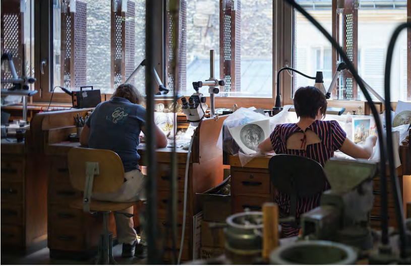
Fig. 6. L'ACOG © Agence Philippe Prost.

À l'arrière de l'équipement, la construction d'un bâtiment neuf pour l'ACOG (atelier central d'outillage et de gravure) réaffirme la permanence de la vocation première du complexe.