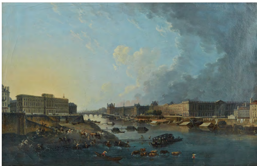
Fig. 1. Le Louvre et la Monnaie vus du Pont-Neuf, par Pierre-Antoine Demachy ; Le palais-usine s'inscrit dans la séquence monumentale des rives de la Seine reconquises.

Célébré dès son achèvement par la presse nationale et par les connaisseurs, l'hôtel de la Monnaie réalisé de 1771 à 1775 sur les dessins de l'architecte Jacques-Denis Antoine, est l'une des dernières pièces d'un échiquier urbain monumental qui se sédimente, depuis la construction du Pont-Neuf et le retournement de la ville sur le fleuve ( fig. 1 ). Longtemps logé dans des bâtiments obsolètes,