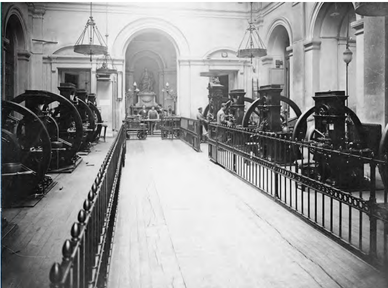
Fig. 3. Le Grand Monnayage, fin xix e siècle © Monnaie de Paris ; L'allégorie de la Fortune sanctuarise ce lieu de production des espèces métalliques, toujours actif