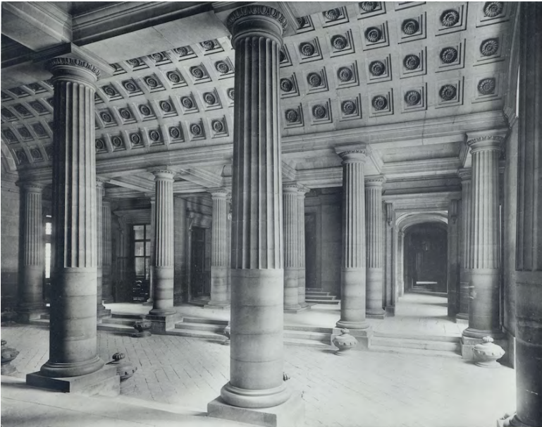
Fig. 2. Le vestibule à 5 nefs, début du xx e siècle