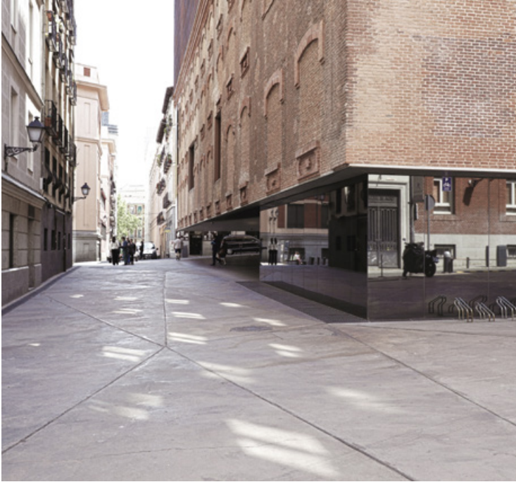
Fig. 2. Fotografía del centro cultural CaixaForum. 2017.