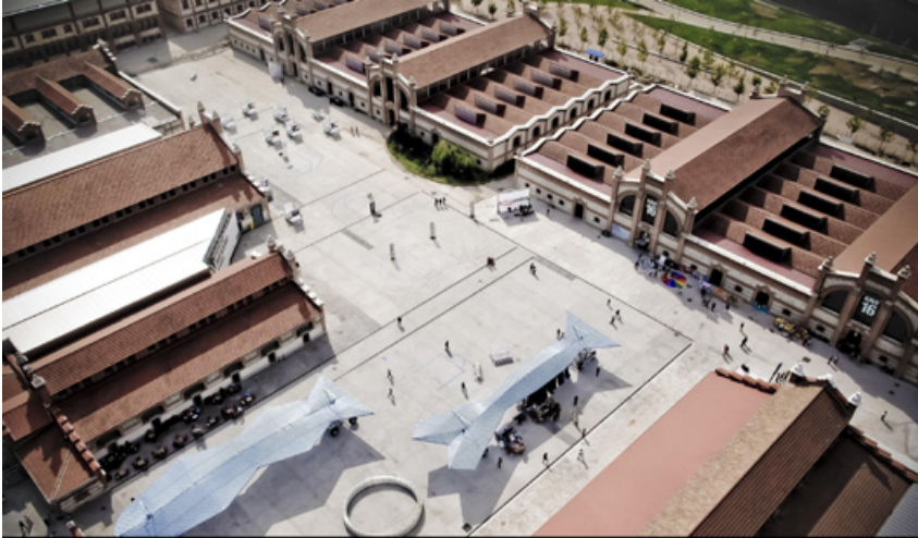
Fig. 4. Fotografía aérea del centro cultural El Matadero. Sin fecha.

El Matadero de Madrid constituye un gran complejo industrial con diversas dependencias 20 . En las décadas de 1980 y 1990 se rehabilitó parte del complejo 21 y a partir del año 2005 22 los restantes edificios como centro cultural ( Fig. 4 ).