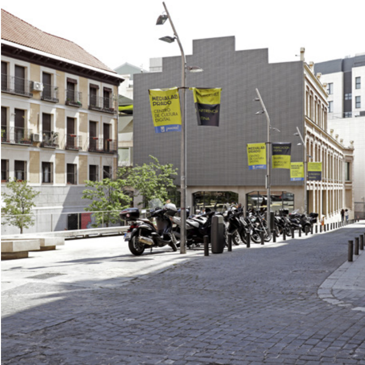
Fig. 3. Fotografía del centro cultural y tecnológico Medialab-Prado (fachada con pantalla digital). 2017.

Sin embargo, habrá que acompañar el desarrollo de este contra-modelo en los próximos años, dado que se encuentra bajo la presión de una estrategia turística importante de la ciudad. Además, el Sitio del Retiro y el Paseo del Prado se encuentran en proceso de una candidatura a Patrimonio Mundial de la Unesco, lo que podrá cambiar los intereses económico-políticos tanto hacia al Medialab-Prado como al caso que se analizará a continuación: la Tabacalera.