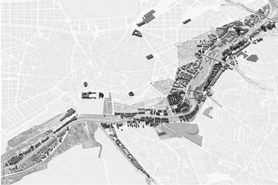
Fig. 4. El río Manzanares hoy: entre el puente de los Franceses y el de Andalucía. Axonometría de la forma urbana.

En general, la margen derecha residencial, construida entre los años 50 y 70, tiene más continuidad como frente urbano que la izquierda correspondiente al casco histórico, con tramos diferentes y discontinuos hasta el barrio de la Arganzuela donde sólo el Matadero y el mercado de Frutas contribuyen al uso cultural del borde edificado.