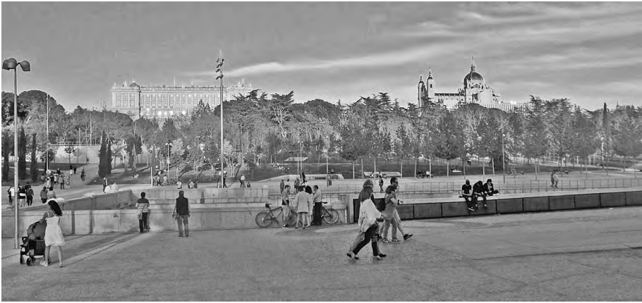
Fig. 1. Cornisas alta y baja. El palacio Real y la Catedral desde el puente del Rey.

Madrid y su río han constituido a lo largo de la historia una imagen ideal que debía representar su capitalidad. El Manzanares, río de poco caudal y no navegable, con crecidas y difícil canalización condiciona la evolución de la forma de Madrid.