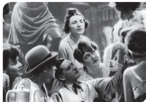
L'Opéra de quat'sous